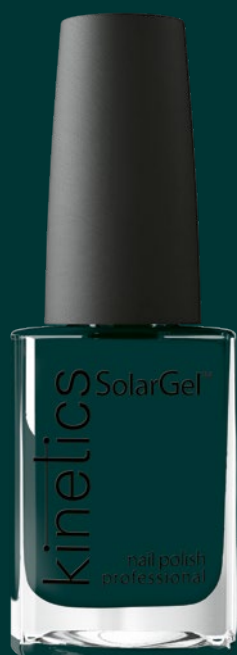
# 682 BOTANICA

ISPIRAZIONE: Profondità · Natura Selvaggia · Forza